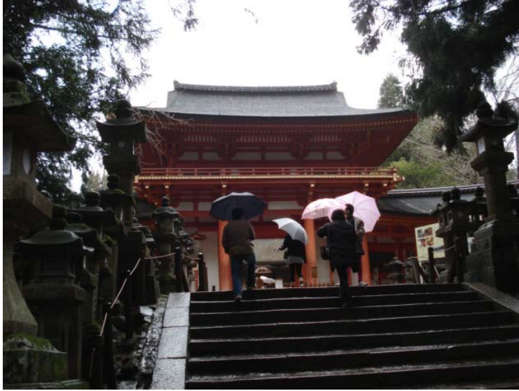
春日大社 な〜んにもなかった。 宝くじが当たるように頼 んだ。