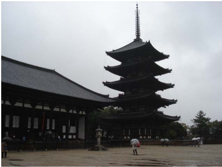
興福寺 五重塔 国宝館で 阿修羅像を拝観